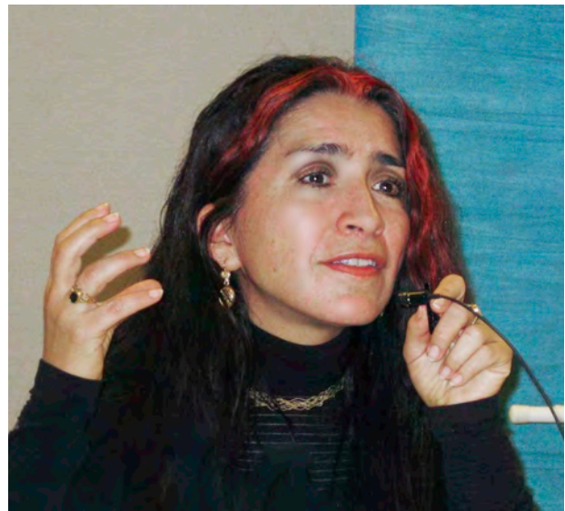
«Schon damals gab es soziale Kooperation. Anders hätte ein zahnloses Individuum nicht überleben können», erklärt Marcia Ponce de Léon.

Zollikofer und Ponce de Léon analysierten die ältesten Homo-erectus-Fossilien, die ausserhalb Afrikas gefunden wurden, nämlich in Dmanisi im heutigen Georgien. Dieser Fund zeigte, dass Europa auch