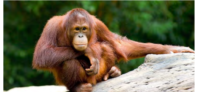
Primaten sind fähig zu lernen, indem sie nachahmen. Sie sind aber weniger experimentierfreudig als Menschen.

Der Mensch ist - im Gegensatz zum Primaten - prosozial, hilfsbereit im weiteren Sinne. «Er gibt sein Wissen weiter, indem er lehrt und so Informationen für alle zugänglich macht», erklärt der Primatenforscher und präzisiert: «Dazu nimmt er einerseits die Sprache und andererseits die Schrift zu Hilfe.» Dies führt zu einer fortlaufenden Kumulation des Wissens.